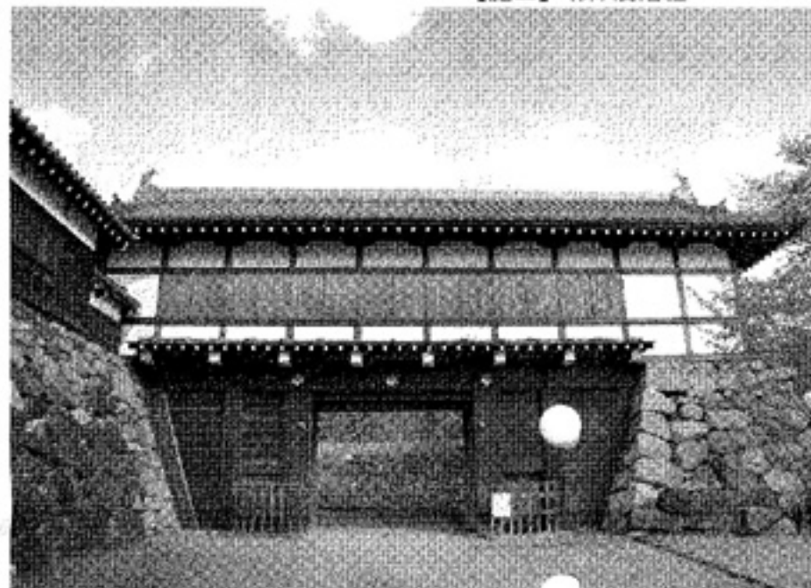
▲郡山城追手門。昭和58年11月3日復元。【設計】(株)構造計画研究所 【施工】(株)浅沼組