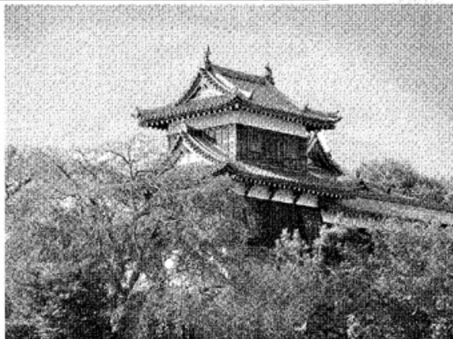
▲郡山城東隅櫓と南北に長い東多門櫓。【設計】(株)構造計画研究所 昭和59年11月復元。【施工】(株)浅沼組