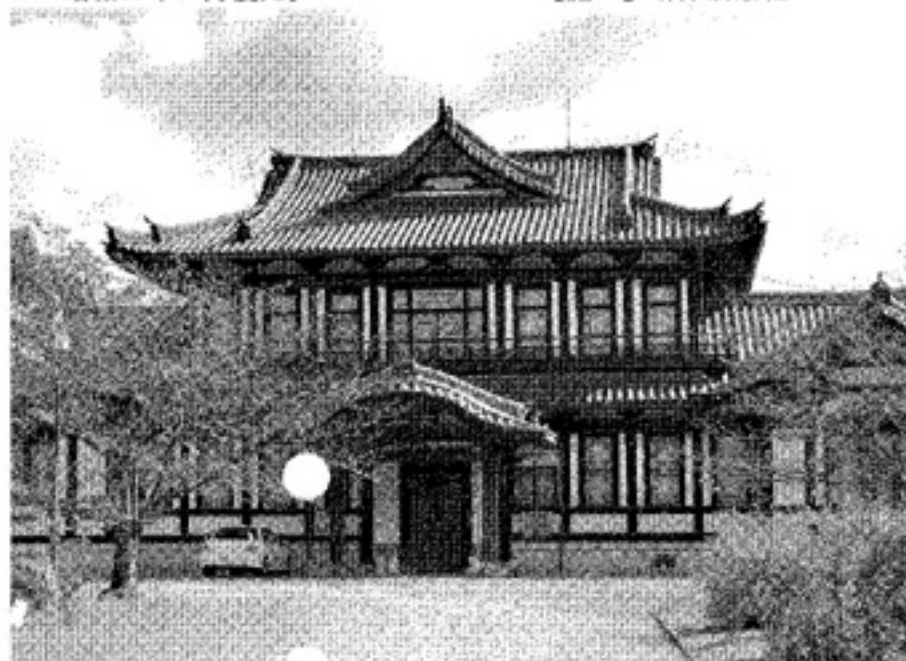
▲大和郡山市市民会館(城址会館)。明治41年10月30日、興福寺境内 に県立図書館として竣工。昭和45年、郡山城址へ移築保存。