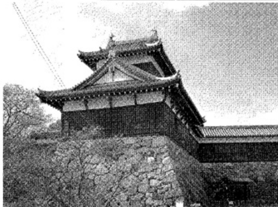
▲郡山城追手門櫓。昭和62年3月復元。【設計】(株)構造計画研究所 【施工】(株)浅沼組