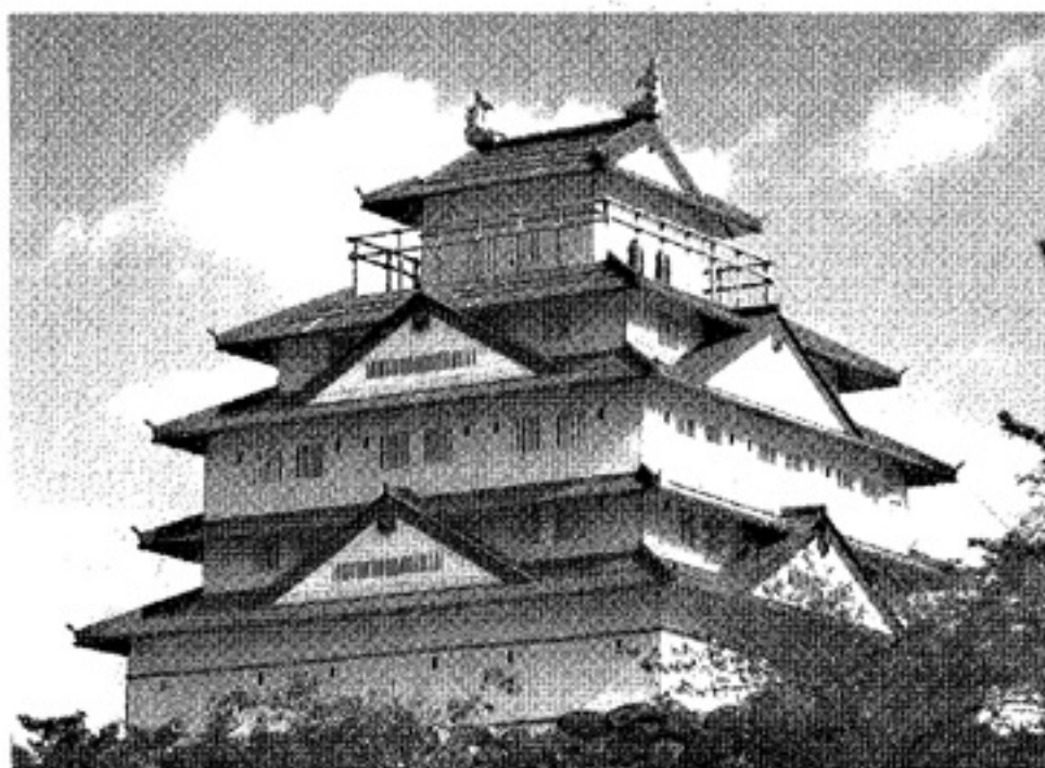
▲五層式の天守閣は、家康大工の中井家に伝わる『淀城天守の図』に基づく。淀城天守は、元郡山城天守を移築しているのほぼ正確な復元が可能となった。